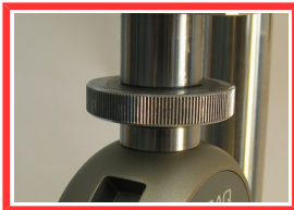
Falsch / Wrong